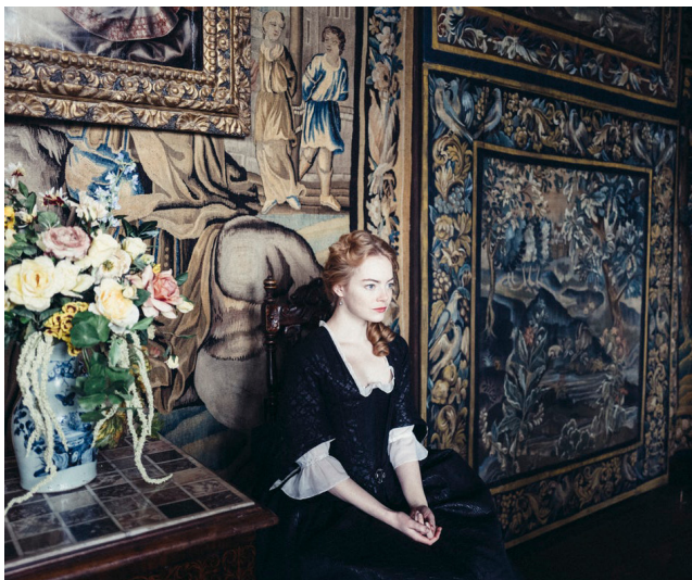
Részlet A Kedvenc című filmből

Miután megemlítettem ezt a nagyon ajánlott alkotást, jöjjön egy olyan is, amiről nem csak én mondom, hogy jó: Oscarék is így gondolták! Itthon 2019 februárjában mutatták be a The Favourite (A kedvenc) című drámai vígjátékot Olivia Colman, Emma Stone és Rachel Weisz főszereplésével. Már ez a színésznőtrió is sejteti, hogy nem érdemes kihagyni a filmet. Aztán ott van még a soundtrack is, amiben nem csak barokk versenyművek jól etalált historikus előadasmódú felhozatalával