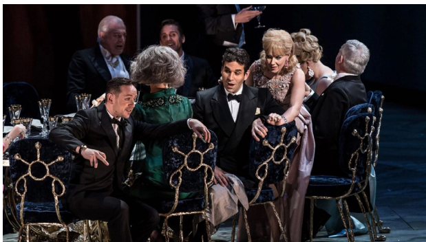
Jelenet Adès operájából